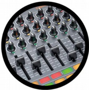
2 pads dédiés à la manipulation d'images en direct