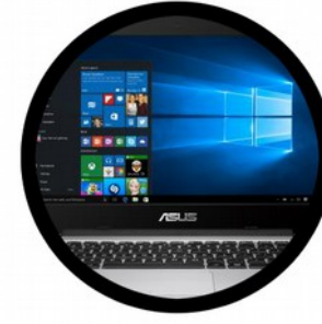
Un ordinateur avec le logiciel de mixage Resolume