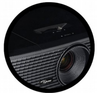
Un vidéoprojecteur pour diffuser le mashup à tous les participants